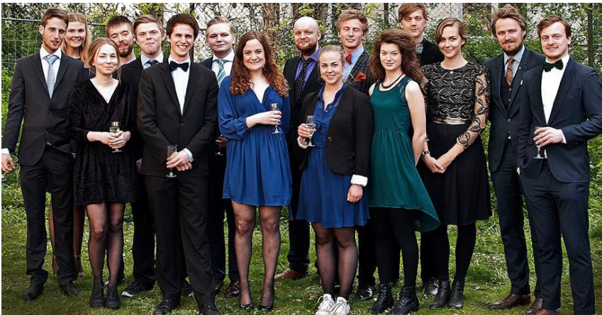
Sittningssällskapet på Gästrik- Hålsinge nation.

Vi i årsmötets delegation från FLiNS är mycket nöjda med hela arrangemanget och ser fram emot ett nytt verksamhetsår fullt av nya möjligheter! Saker som PolRiks tänkt göra kommande verksamhetsår inkluderar bland annat arrangerandet av Samhällsvetar-SM och en utlandsresa.