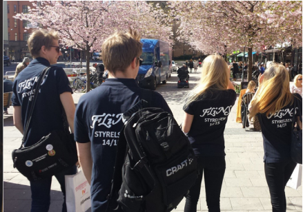
Ute och spatserar på Södermalm

och nyckelband, high-fiveade med Skellefteå kommun efter SM-guldet, åt svindyrt sallad från Hemköp, utbytte lumpenminnen med personal ur Attunda, gjorde ett yrkestest, var på hipsterspaning m.m. m.m.