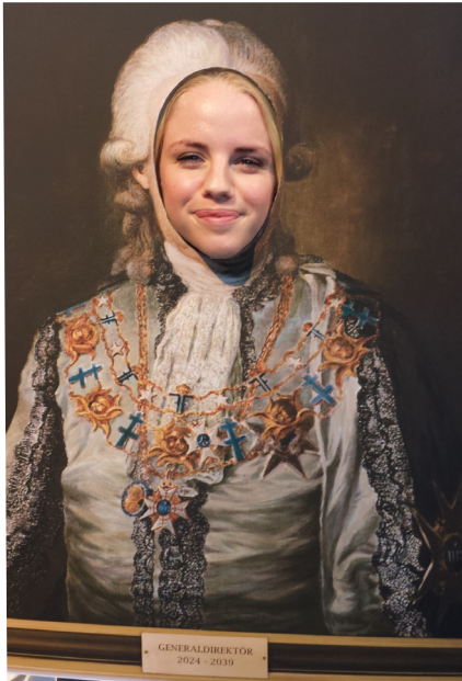
Linnaeus som generaldirektör för Kammarkollegiet