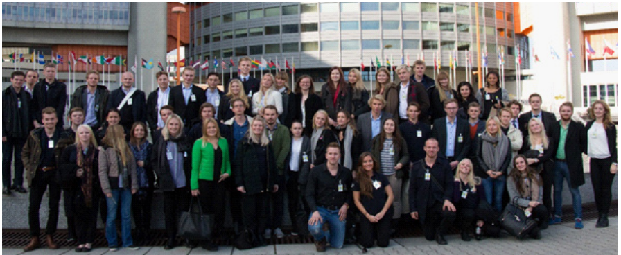
Bilder från FN högkvarteret i Wien och utan för OSSE