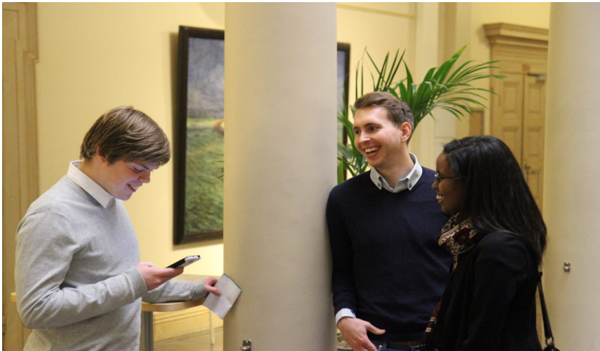
Per checkar av läget med två av deltagarna