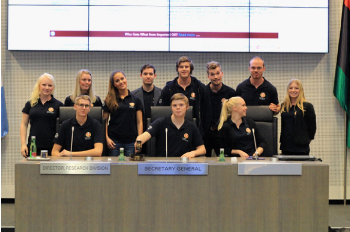
FLiNS-styrelsen på Opec