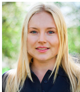
Sammanställt av: Johanna Eriksson Alumniansvarig

Jag ska till Melbourne och träffa gamla utbyteskompisar från Hong Kong och leva life! Fota skitmycket. Så in i bängen. Och typ tänka på hur härligt och konstigt oförutsägbart livet är.