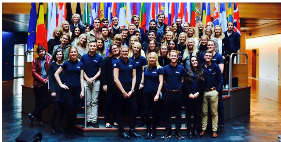
Från besöket på Europaparlamentet