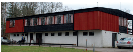
Skytte-C, snart ett minne blott

Oss lämnar han med några visdomsord om respekt och sunt förnuft: ”Jag hoppas att ni finner något annat ställe som kan vara lika trevligt. Vad ni än gör så visa respekt åt er motpart, det grundläggande i alla mänskliga kontakter och kontrakt, det är att visa respekt och då säger jag sunt förnuft, och det har alla, men kanske inte när man har druckit så mycket öl eller något annat gott.”