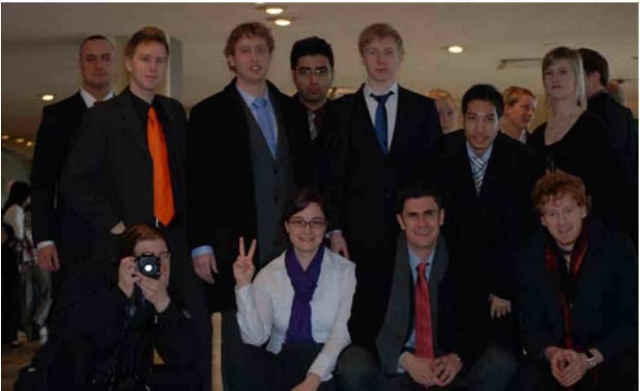
En del av UF-gänget poserar.