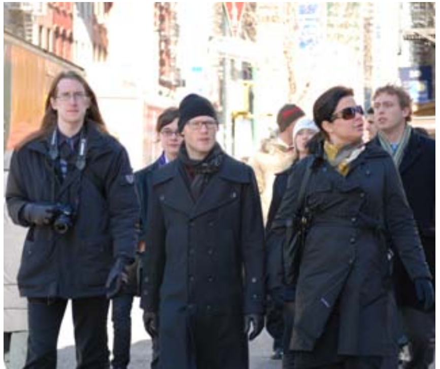
UF-medlemmar turistar på amerikansk mark.