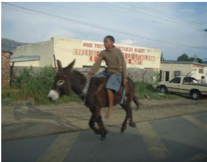
En pojke rider på en åsna, en vanlig syn längs vägarna i Sydafrika

För mig ter det sig motsägelsefullt då studier bland annat har visat att många barn antingen inte går i skolan alternativt har stora inlärnings-svårigheter på grund utav hunger. I längden kommer detta skapa mer beroende då de i framtiden kommer ha mycket lägre chanser att få ett jobb och försörja sig själva. Som det är nu är "gangsters" mer inflytelserika som förebilder än Nelson Mandela.