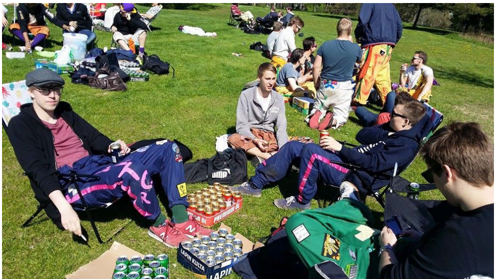
En bild från Flakdagen 2015

Kårallen flyttar ut och om vädret tillåter dansas det under stjärnorna sent inpå natten. I slutet av detta års vårtermin var det Prinsen av Peking som besökte Linköping och Utekravallen.