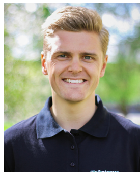
Skribent: Ola Gustavsson FLiNS representant i Pol.riks